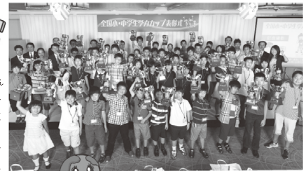
各学年全国トップ10の金賞受賞者全員で記念撮影が行われました(2014年7月13日 帝国ホテル東京)

「学力」とは、問題解決能力である。これは、2011年の創立当初から学力カップが掲げていた主張です。現在進行中の国家規模の教育改革に先駆け、時代の先を進む学力カップに共感と支持の輪がますます拡がり、今年は例年にないペースで多くの塾がエントリーしています。科目の枠を越え、子供たちの思考力や主体性を刺激するオンリーワンの特別なテスト・学力カップに、みなさんぜひチャレンジしてください。